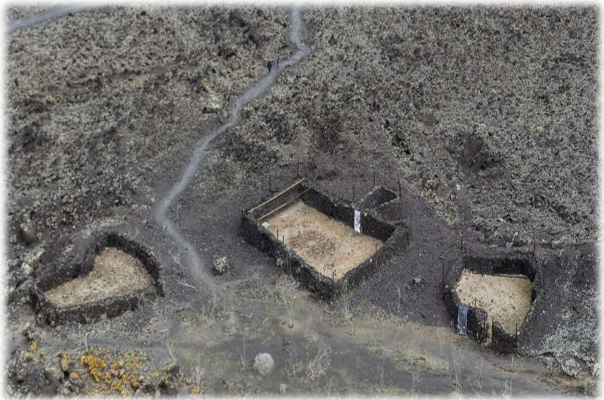
Onder ons liggen enkele schapenstallen.