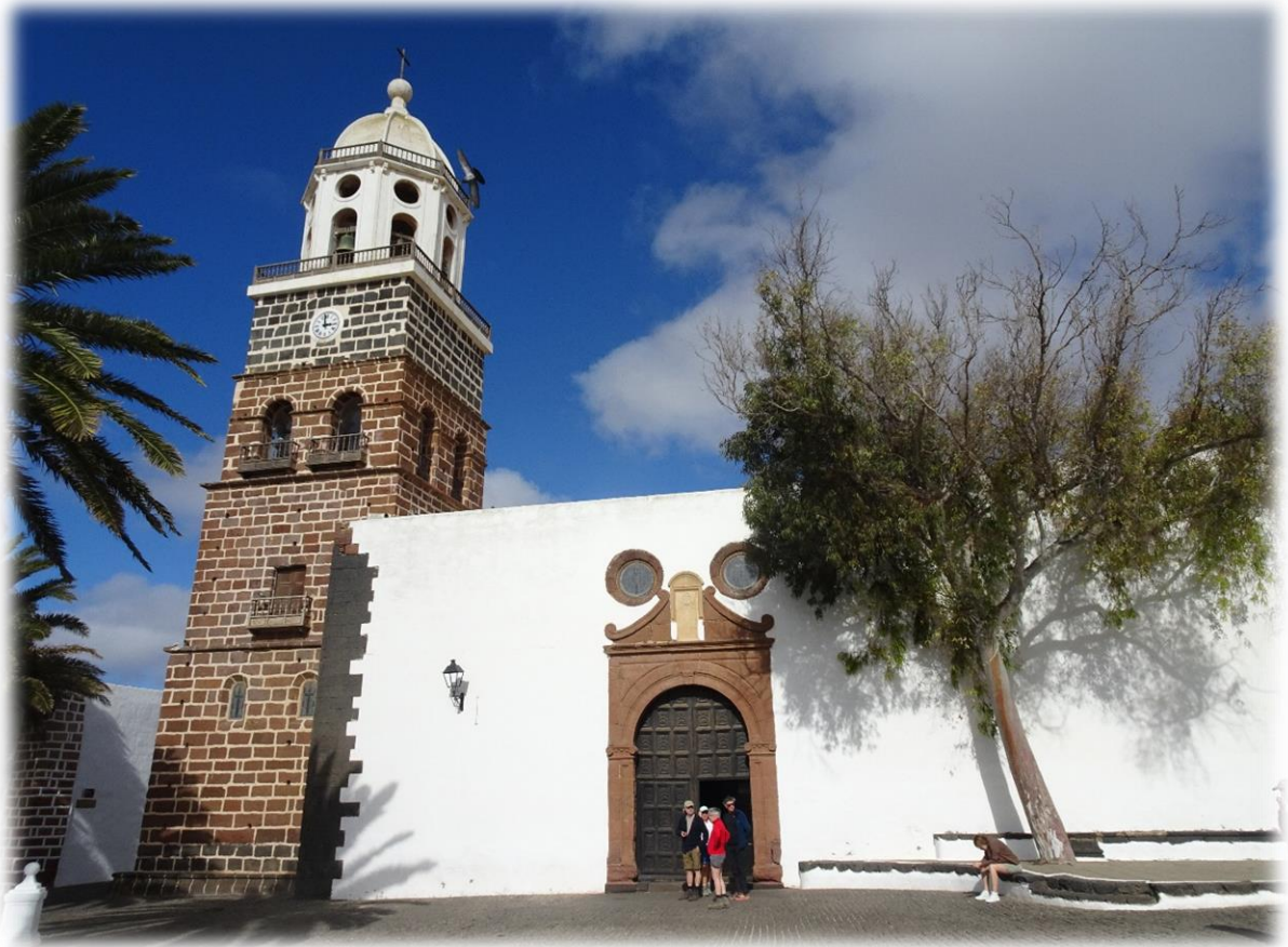
Na onze wandeling brengen we een bezoekje aan Tegüise, de vroegere hoofdstad van Lanzarote.