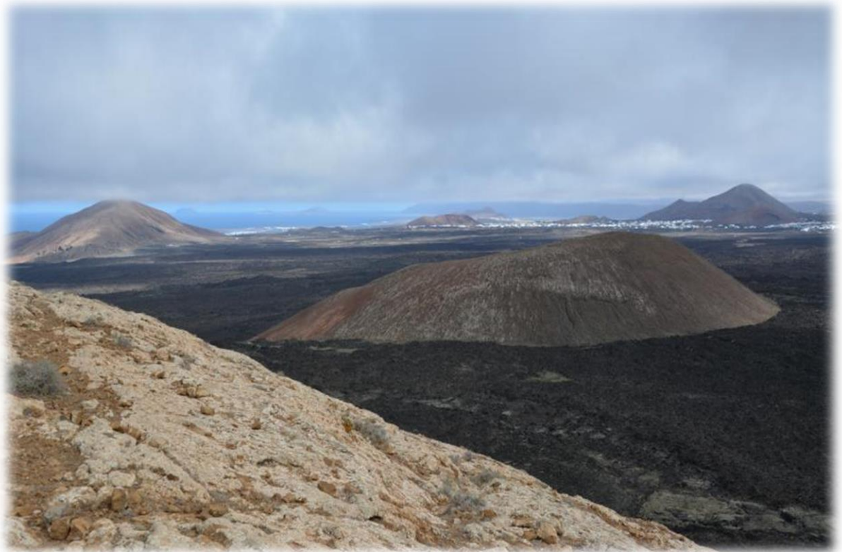
Van op de kraterrand van de Caldera Blanca (witte krater) kan men duidelijk de zwarte