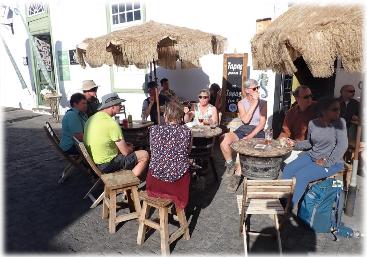
En natuurlijk mag een terrasje niet ontbreken.