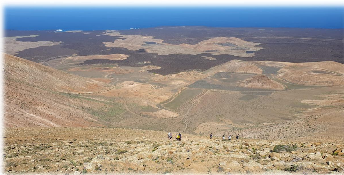
Ook de oversteek van het lavaveld is zonder problemen verlopen.